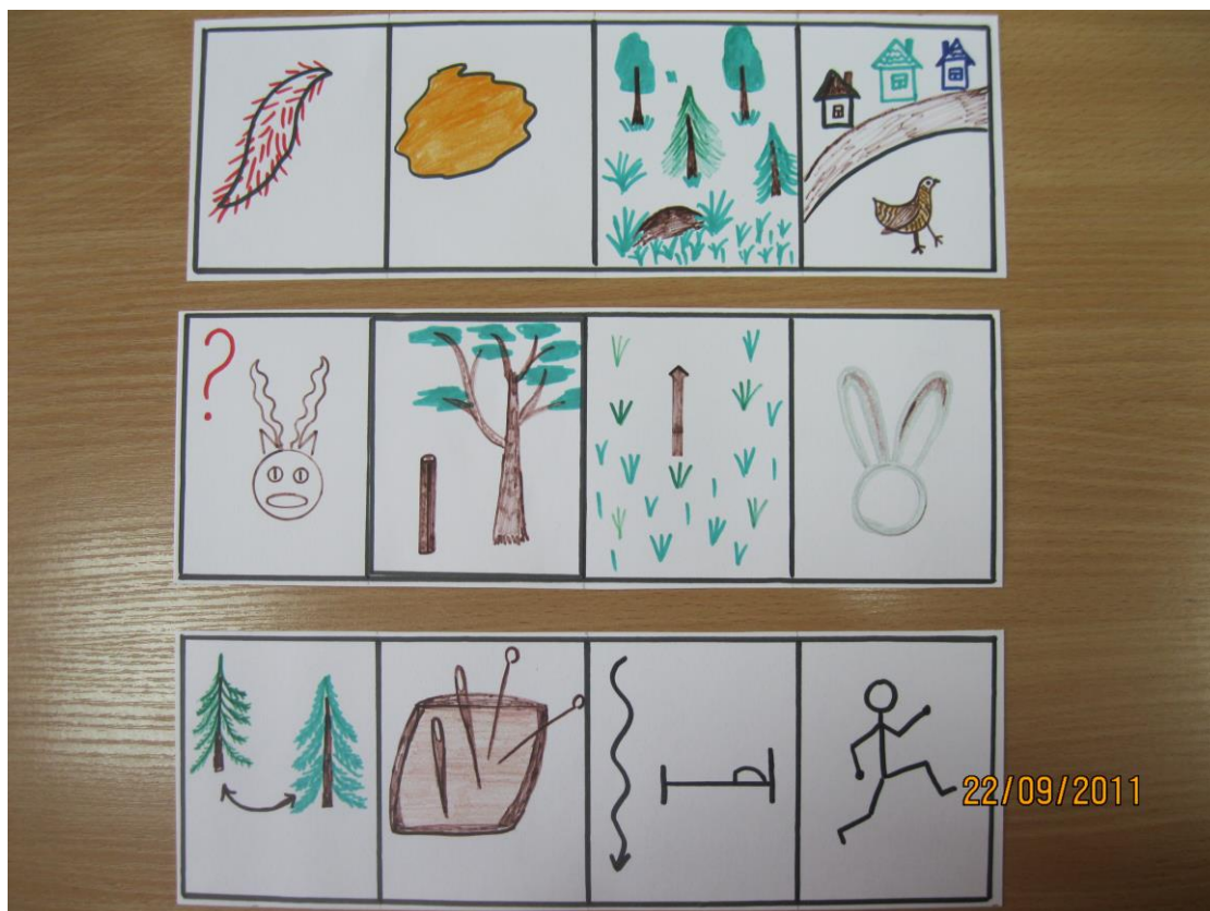
Рис.3 Мнемотаблица к пословицам

Когда дети накопят небольшой опыт в нахождении ассоциаций, мы продолжаем работу по зарисовке слов, несложных предложений, загадок: