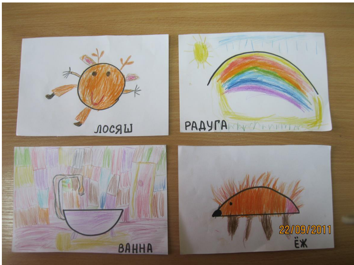
Рис.2 «На что похоже?»