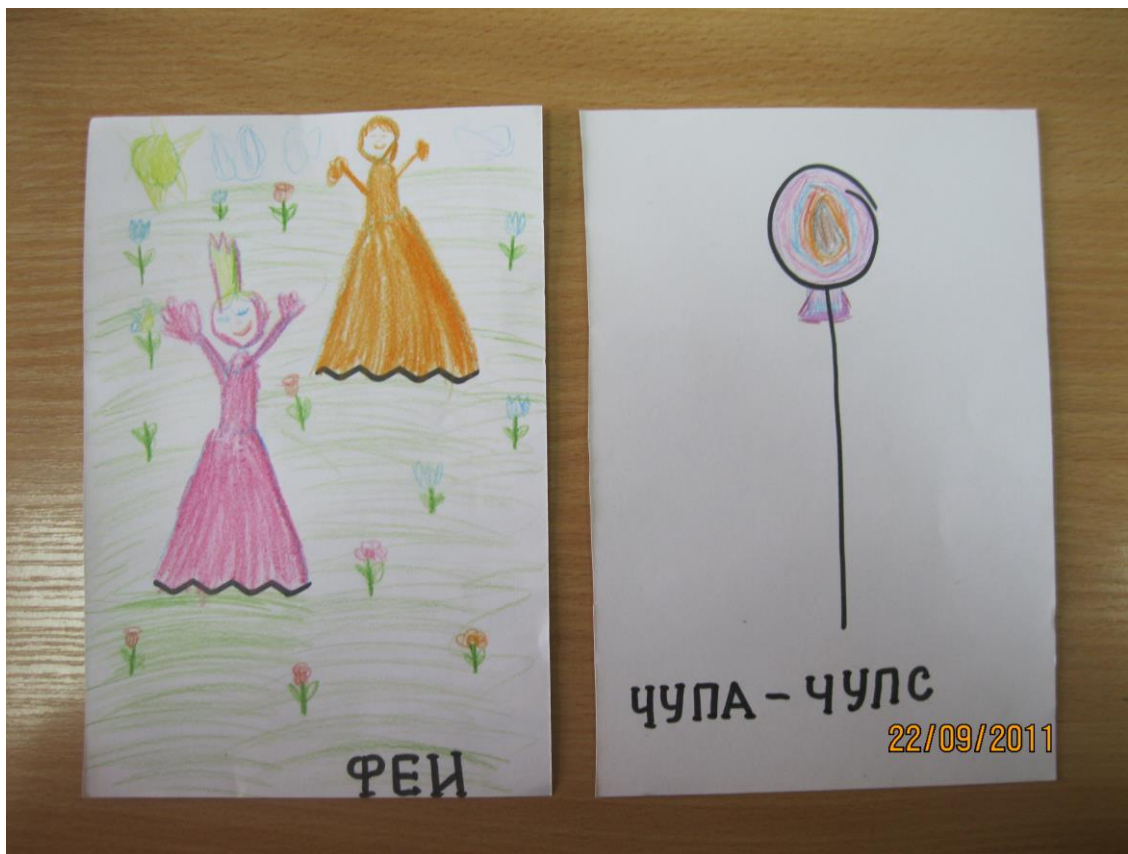
Рис.1 «Дорисуй. Что получилось?»